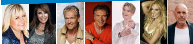
Gaby Baginsky, Ireen Sheer, Olaf Berger, Peter Orloff, Vincent Gross, Loona und Olaf Henning